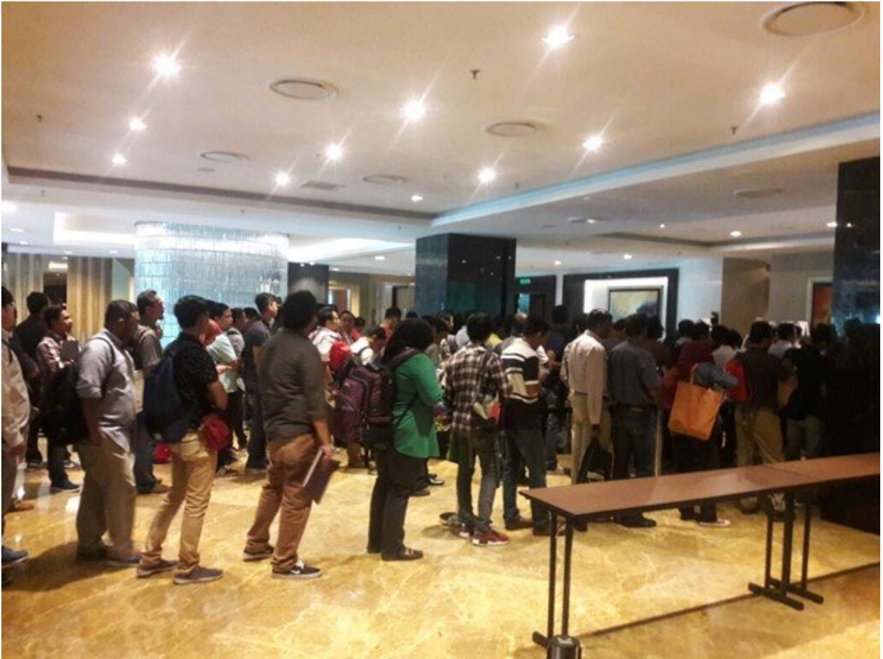
Panjang Juga Kan...

Jauh tau gambar atas tu. Kalau tengok tengok betul, korang akan perasan. Saya punya beratur berpusing habis. Tapi tak apa, ku teruskan juga.