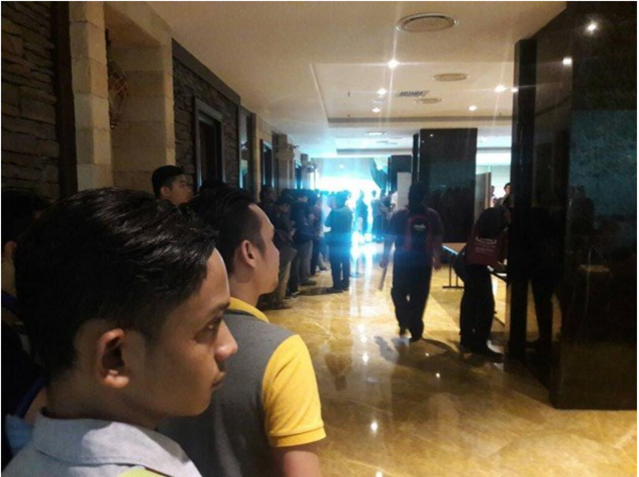
2 ekor ni lah kenalan saya yang duk sembang