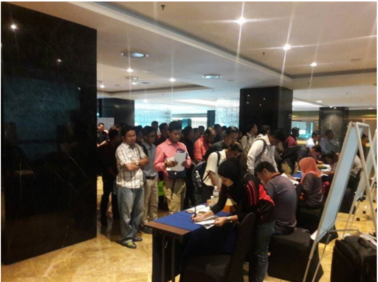
Baju putih usha saya, macam la orang nak amik gambar dia. Ini adalah kaunter pendaftaran.

Apa apa pun, jum kita tengok beberapa keping gambar yang saya sempat amik dulu.